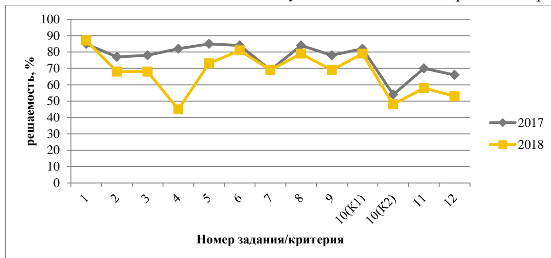
Выполнение отдельных заданий ВПР участниками из Хабаровского края

В 2018 году также прослеживалась взаимосвязь задания 4 с историческим источником. В одном варианте необходимо было определить, следствием какого события стала окончательная ликвидации «рабства», упоминаемого в отрывке из сочинения историка. У выпускников вызвало затруднение соотнести битву на реке Сити (1238 год), упоминаемую в тексте и «стояние» на реке Угре (1480 год), следствием которого стало окончание зависимости русских земель от ордынских ханов. В другом варианте учащиеся не смогли сопоставить интервенцию времен Гражданской войны с периодом Смутного времени в русской истории.